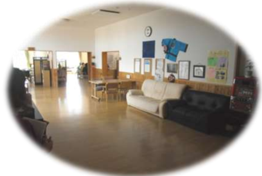
▲地域交流スペース

なお、要介護1や要介護2の方であっても、やむを得ない事情により、特別養護老人ホーム以外での生活が困難な方については、特例的に入居できます。